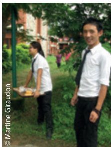
Deux étudiants de l'Institut Technologique Tibétain.

Si vous souhaitez vous aussi aider un projet de votre choix, indiquez dans votre courrier celui auquel vous attribuez votre don. Vous recevrez chaque année un reçu fiscal, car les dons de l'AET sont déductibles des impôts à hauteur de 66% dans la limite de 20% du revenu imposable. Merci pour votre indéfectible générosité.