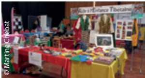
Le magnifique stand AET de la Délégation des Alpes-Maritimes (DR 06).