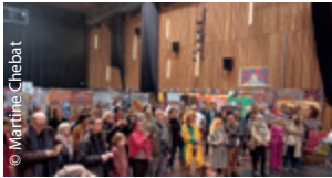
Le public des Journées Tibet de Villeneuve-Loubet a répondu présent en dépit des intempéries (DR 06).