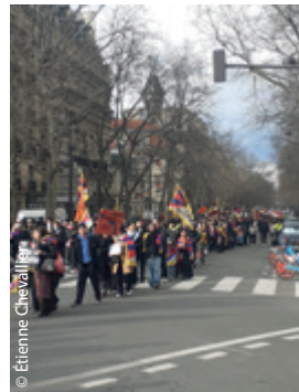
Drapeaux, slogans et poussettes, un cortège plein d'énergie.