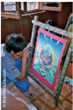
© Martine Graudon Écoliers des montagnes reculées, étudiants des arts tibétains, aidons nos filleuls de toutes nos forces.