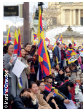
Du Trocadéro aux Invalides, l'arrivée sur la Place Vauban...