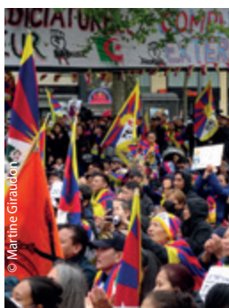
Une foule énorme, plus de 2000 enfants et adultes, attentifs et déterminés malgré les assauts d'une pluie intermittente.