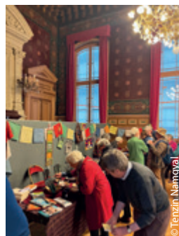
Merci d'avoir acheté à l'AET, puisque les profits vont à nos projets en Inde et au Népal...