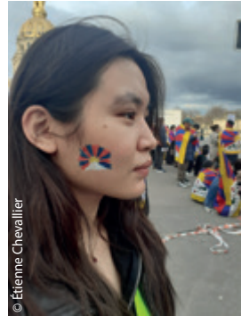
Jeune manifestante tibétaine, 10 mars 2024.

Chaque année des parrains se joignent aux manifestations des Tibétains, notamment pour commémorer le Soulèvement de Lhassa du 10 mars 1959 . La marche 2024 du Trocadéro aux Invalides, non loin de l'ambassade de Chine, a rassemblé une foule énorme, car c'était un dimanche et quel plaisir de retrouver les uns et les autres, déterminés, avec plein d'enfants en tenue tibétaine, et même un Tibétain de Tours, qui lit notre Tashi Delek à chaque parution ! Je déplore en revanche, en vieille habituée des marches du 10 mars, qu'on soit maintenant si peu de Français, à l'inverse d'autrefois, à les accompagner.