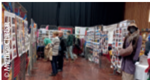
Et son exposition photos offerte à tous les visiteurs.