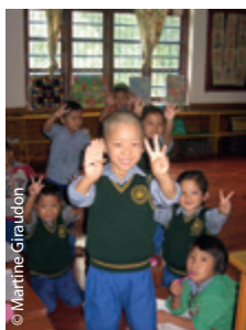
Des petits enfants désireux d'apprendre.