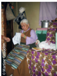
Une bien jolie vieille dame.