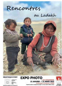
L'affiche de leurs Rencontres au Ladakh, où ils présentent aussi l'action de l'AET et même des enfants à parrainer...