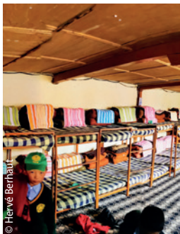
En visite au dortoir où les enfants échangeront leurs uniformes d'écoliers pour les habits du dimanche.