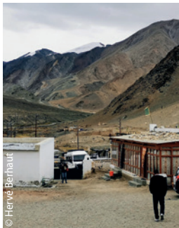
Après le voyage dans l'immensité des hautes montagnes, l'entrée de l'école de Sumdo.