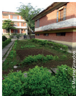
Le potager derrière les bâtiments d'internat est cultivé par les enfants, pour manger bio et en autonomie.