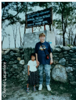
© Renée Lacarrière Première visite de Renée au camp de réfugiés tibétains de Jampaling, au Népal, le 13 avril 2002.