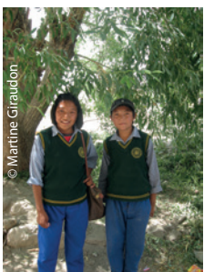
Les petites graines du Tibet, dont beaucoup sont parrainées par l'AET à TCV Choglamsar. La jeune écolière en T-shirt rose de la photo 2 est devenue infirmière après des études supérieures à Mangalore, en Inde du sud, la jeune fille avec le sac en bandoulière de sa marraine sur la photo 3 a choisi de devenir nonne au Sikkim après sa classe 12 et l'obtention de son baccalauréat à Dharamsala.