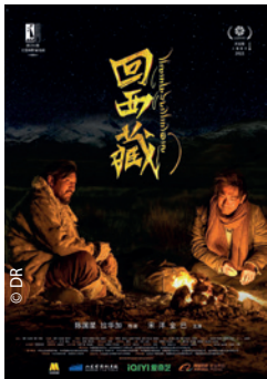
Affiche du film Kong and Jigme, de Guoxing Chen et Lhagal Gyal.