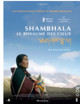
L'affiche du Léopard des Neiges du Tibétain Pema Tsenden figurait déjà dans le TD 109, alors voici celle de Shambhala , superbe film népalais tourné en tibétain et en région de culture tibétaine, évoqué page 14 de ce numéro. Le DVD du Léopard des neiges sortait le 18 février, celui de Shambhala sortira le 1er avril 2025.