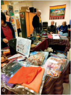
Une week-end des 14 et 15 décembre bien rempli, nos administrateurs sont eux aussi de purs bénévoles.