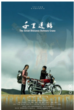
Affiche du film Great Distance Delivers White Crane, de Lhagal Gyal