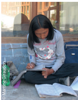
Ces petits enfants de Sumdo vont ensuite en internat à TCV Choglamsar. Ils retournent dans le Jangthang aux grandes vacances, jusqu'à la Rentrée début mars.

Depuis 44 ans maintenant, l'AET aide les Tibétains réfugiés en Inde et au Népal à Sauver leur culture . Souvenir du voyage 2024 au Ladakh, cette page s'ouvre sur un petit texte de Janine, qui accompagnait avec Gilbert le groupe AET. Cette année, le Tibetan Children's Village du Ladakh va célébrer son Jubilée le 12 septembre . Les parrains avertis par l'école ont commencé très tôt à se positionner auprès du Siège pour y participer avec l'AET, le départ serait un peu avant cette date du 12.