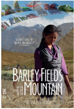
Affiche du film de Tian Tsering, Un Champ de l'autre côté de la montagne.