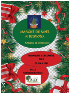
Une des jolies affiches envoyées pour ses Marchés de Noël par Monique Piat (DR 86).