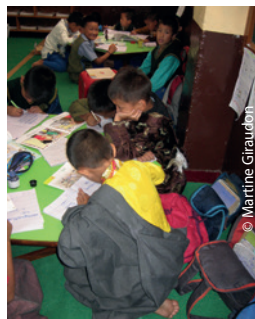
Chaque petit écolier est invité à construire son avenir en tant que jeune Tibétain et ça travaille dur !