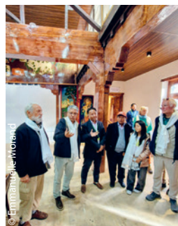
Sans oublier le fameux Hall Dekyi Woenang, pour la rénovation duquel le CA de l'AET avait voté 32 900 € le 14 décembre 2024.