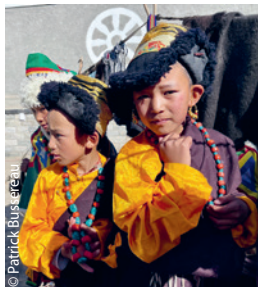
Petits écoliers de Choglamsar, très fiers de participer au Jubilee à TCV Choglamsar avec leurs beaux costumes.