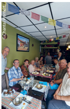
Un joyeux repas annuel aux Saveurs tibétaines pour rassembler les parrains de la DR 31 qui le souhaitent.