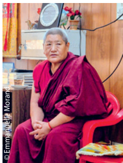
© Emmanuelle Morand La nonne de TCV Gopalpur, dont Emmanuelle a consigné le touchant témoignage.