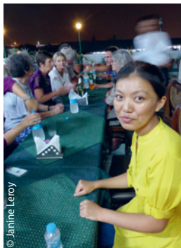
© Janine Leroy La fille de Norbu, héroïne du petit Pema écrit par sa marraine, et maintenant infirmière en soins intensifs en Angleterre.