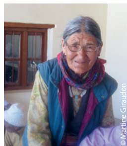
En Inde comme au Népal, les Personnes âgées sont la Mémoire du Tibet, avec derrière eux toute une vie de dur labeur en exil.