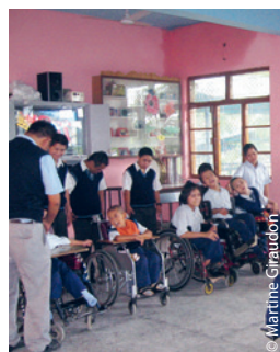
Les jeunes Tibétains handicapés de la Ngoenga School méritent notre compassion, et aussi notre aide.