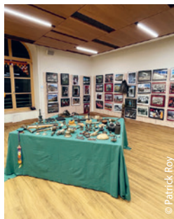
Une belle salle d'exposition de la DR 25, immobile et silencieuse avant l'arrivée des visiteurs.