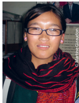
Les Étudiants sont la force vive du Futur des Tibétains, puissent leurs études être poussées le plus loin et le plus haut possible grâce à nous !