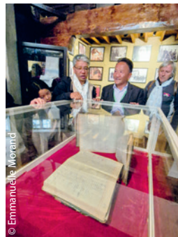
Et la merveilleuse et émouvante exposition des 50 ans, évoquée par Karma dans son éditorial du TD 112.