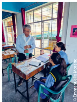
Karma se découvrirait-il une nouvelle vocation à TCV Suja ?