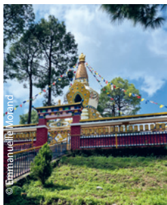
Le cadre idyllique de l'école de Gopalpur, non loin du zoo caché dans les pins.