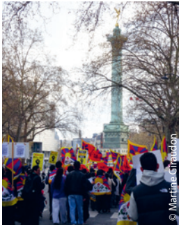
L'arrivée à la Bastille, où vont reprendre slogans, prières et discours des différentes associations tibétaines.