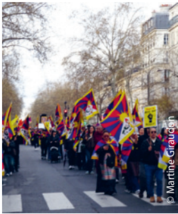
Deux colonnes denses de manifestants de tous âges, parfois en poussette, sur le boulevard Beaumarchais en direction de la Bastille.