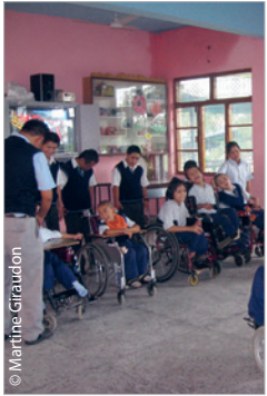
Les 5 000 € en faveur de nos jeunes amis de la Ngøenga School sont déjà collectés et envoyés. Merci pour eux !