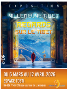
L'Affiche de Villeneuve-Loubet invitant à l'exposition RegARDS sur le Tibet du 5 mars au 12 avril 2026. La DR 06 faisait partie des expositants.