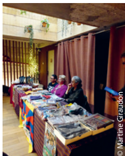
Un stand d'artisanat qui a enregistré une vente de 470 €, ce qui n'est pas mal en si peu de temps. Merci à vous tous, chers parrains et marraines !