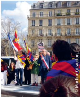
Sur le podium dressé Place de la République, après minute de silence et hymnes des deux pays, les discours avant le signal du départ de la Marche.