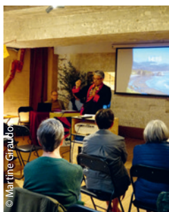
Un écran pour projeter nos tableaux financiers. En bref, une Assemblée sous le signe de l'amitié, de l'énergie et de la confiance dans l'avenir.