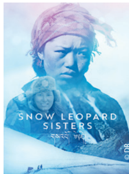
Une belle affiche pour le film de Sonam Choekyi Lama, Ben Ayers et Andrew Lynch, Snow Leopard Sisters (2025) .